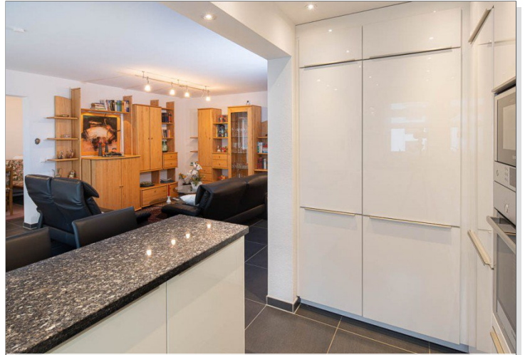
Blick von Küche