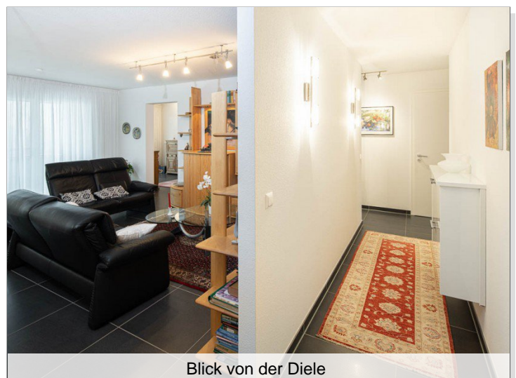
Blick von der Diele