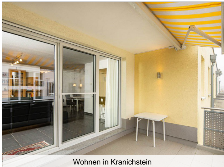
Wohnen in Kranichstein