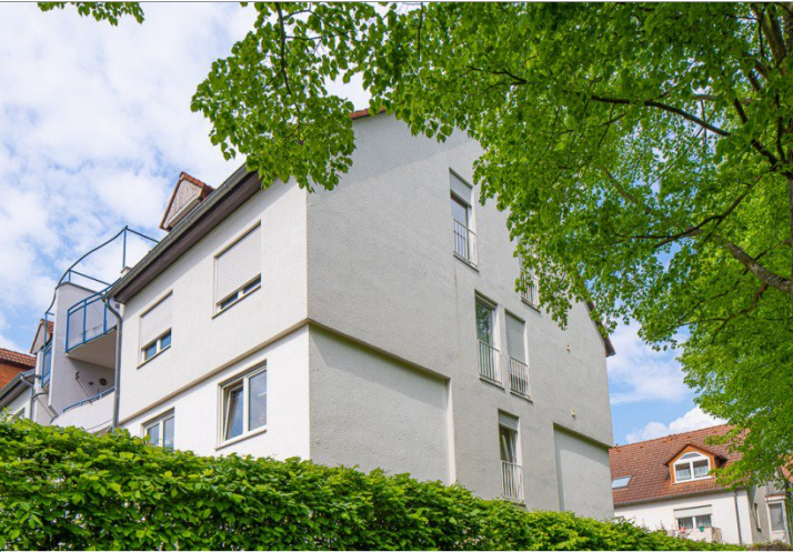
Ihre Wohnung in Darmstadt-Kranichstein