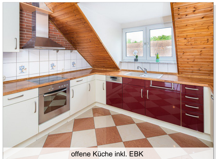
offene Küche inkl. EBK