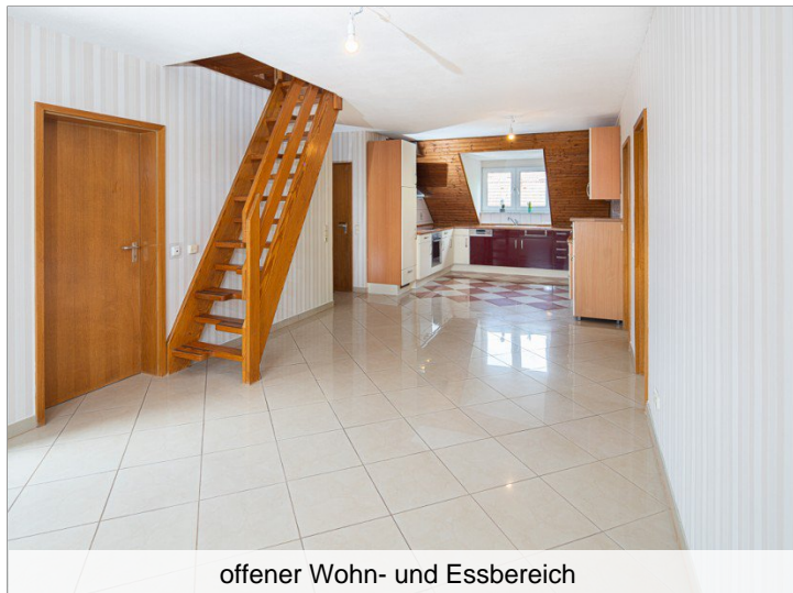
offener Wohn- und Essbereich