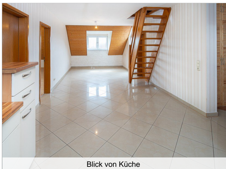
Blick von Küche