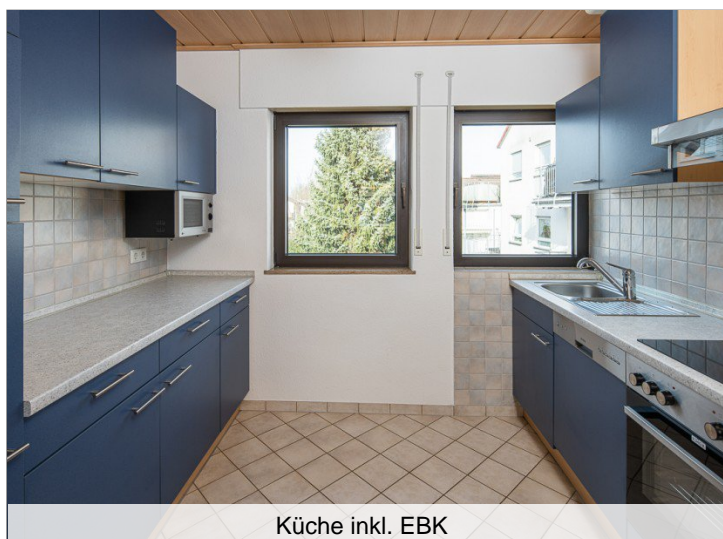
Küche inkl. EBK