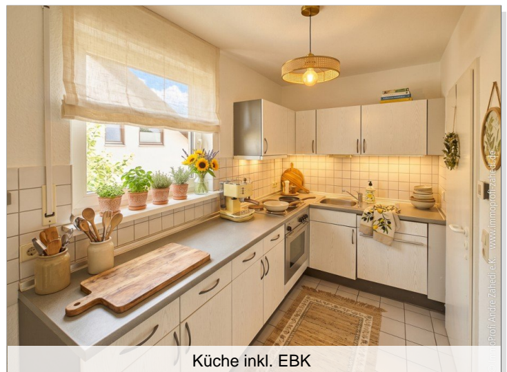
Küche inkl. EBK