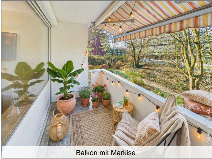
Balkon mit Markise