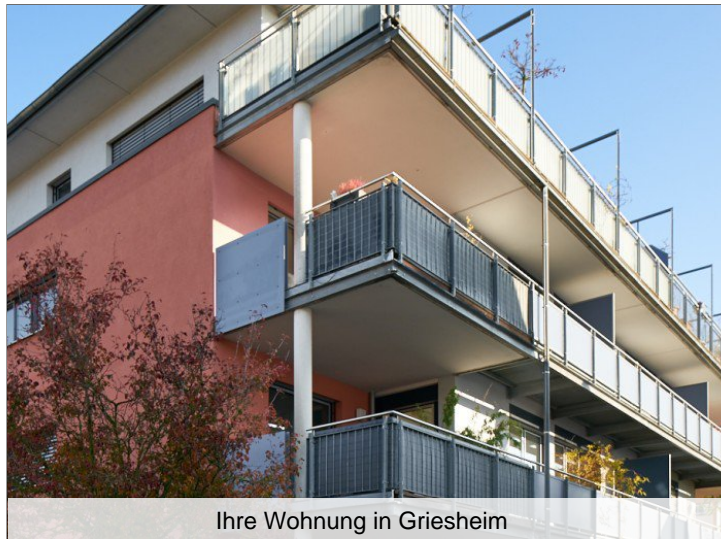
Ihre Wohnung in Griesheim