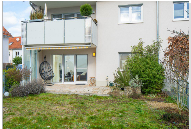
Blick vom Garten