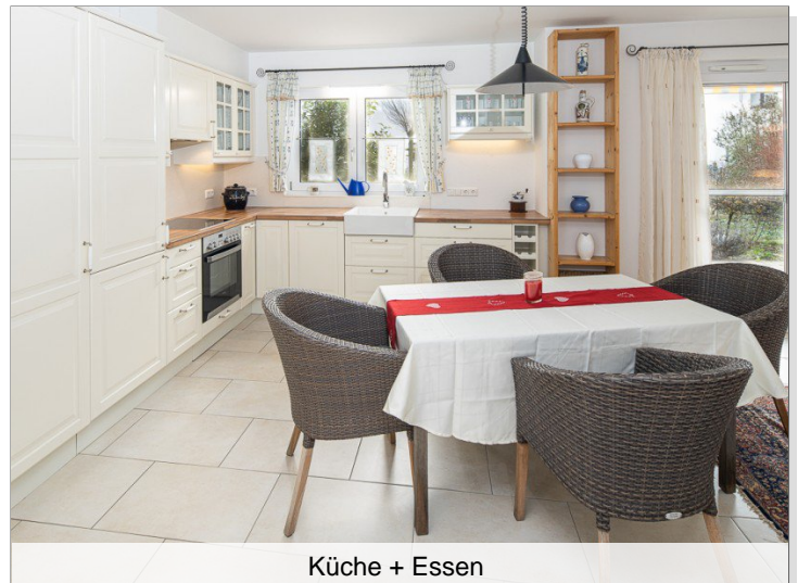
Küche + Essen