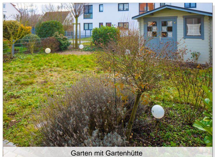
Garten mit Gartenhütte