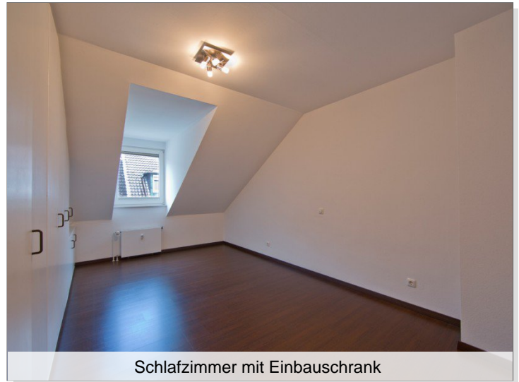
Schlafzimmer mit Einbauschränk