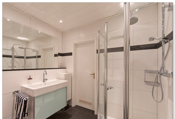
Badezimmer Bild I