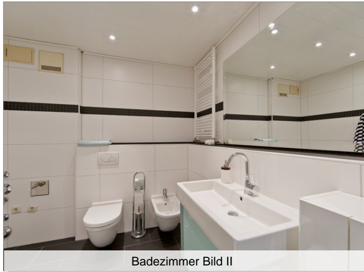
Badezimmer Bild II