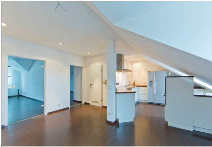
Blick von Essbereich