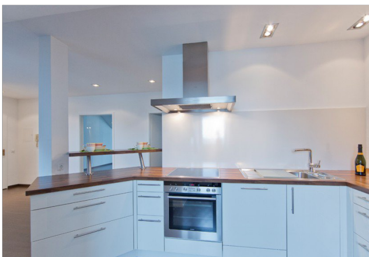
Blick von Küche