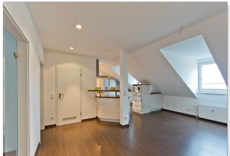
Küche und Essbereich