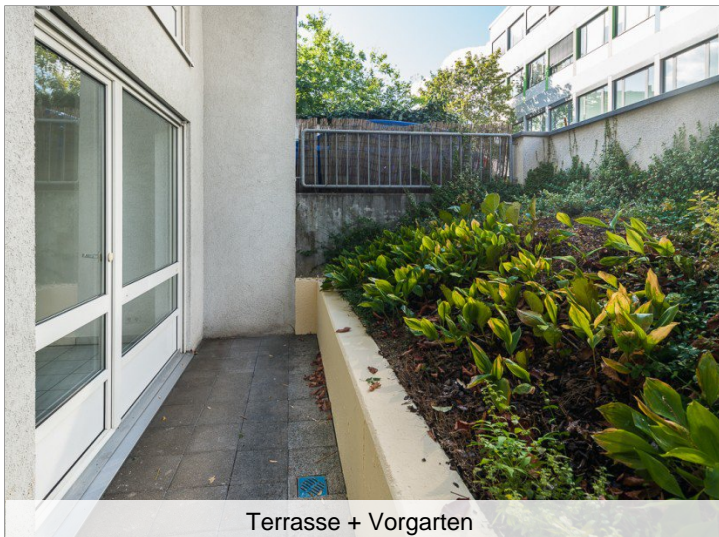
Terrasse + Vorgarten