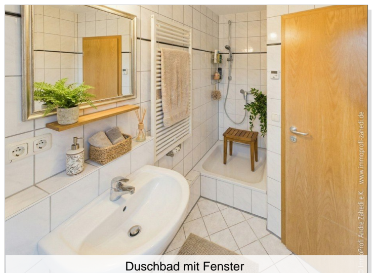
Duschbad mit Fenster