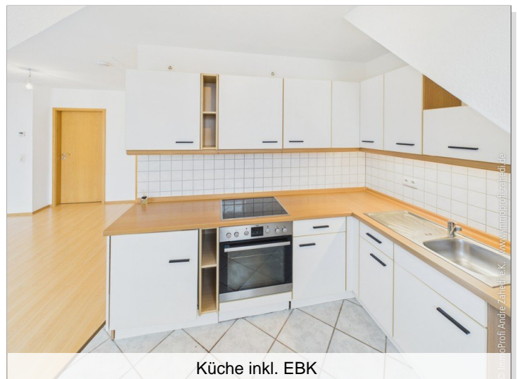
Küche inkl. EBK